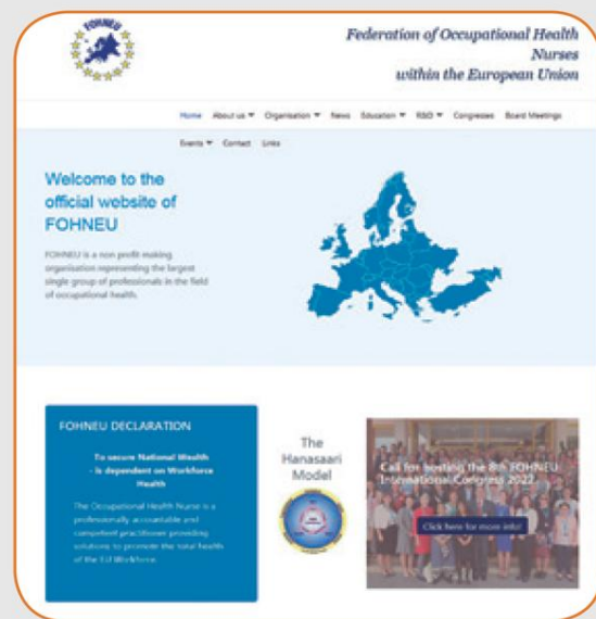
Portal de la Federation of Occupational Health Nurses within the European Union.