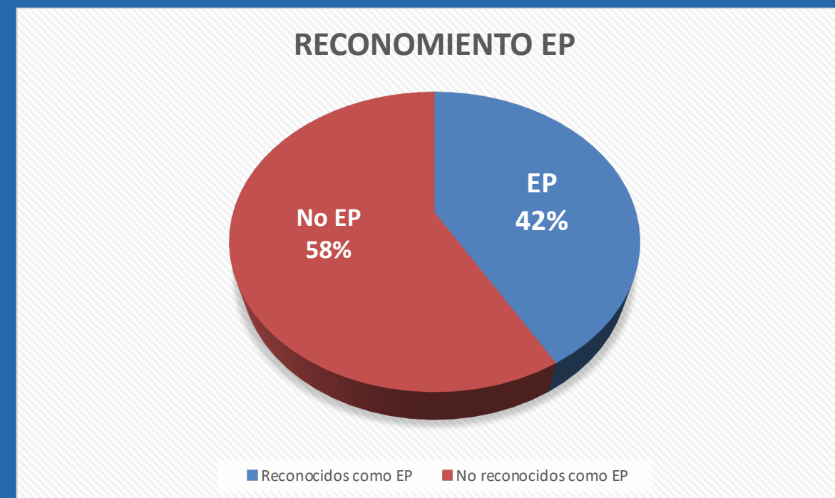
Figura 1. Reconocimiento EP